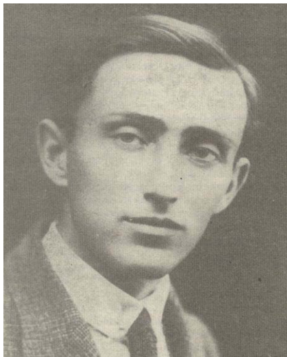
Szél Tivadar (1893–1964)