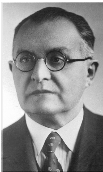
KOVÁCS ALAJOS (1877–1963)